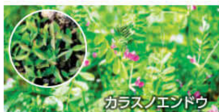
カラスノエンドウ