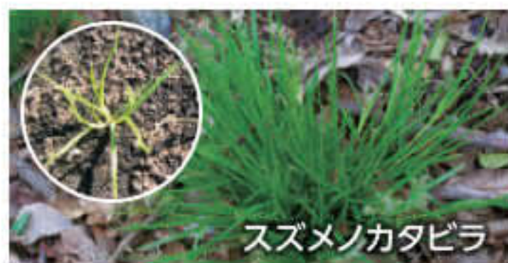
スズメノカタビラ