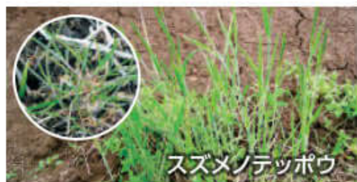
スズメノテッポウ